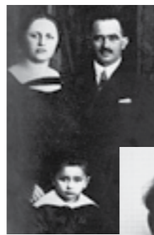
Samen met zijn ouders

Celan is niet de echte naam van de schrijver. Meer weten over zijn jeugd? Ga naar biografie Verdieping > achtergrondinformatie